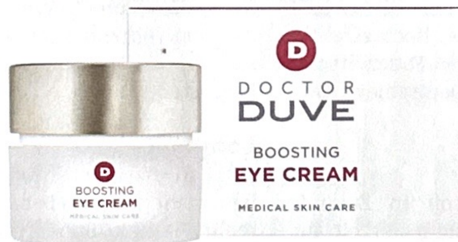
2009 lancierte er seine medizinische Hautpflegelinie «Doctor Duve Medical Skin Care», die heute 30 Produkte umfasst

ästhetische Chirurgie und Medizin und vereint seit 2018 die vier Säulen plastische Chirurgie, Dermatologie, Gesundheit und Kosmetik . Basierend auf dem Fundament der Wissenschaft unter dem Dach der Schönheit arbeitet ein Team aus acht Ärzten und drei Kosmetikerinnen am Utoquai 39/41. Dr. Duve bereichert das Angebot der Tagesklinik mit seiner einzigartigen Kompetenz im nicht-invasiven Bereich der ästhetischen Dermatologie.